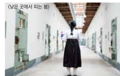
〈낮은 곳에서 피는 봄〉

■ 위 프로그램들은 CGNTV홈페이지(www.cgntv.net)를 통해 다시 시청하실 수 있습니다.