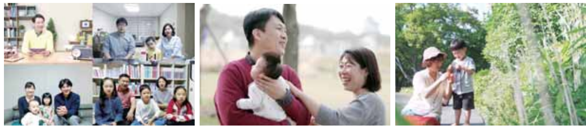
〈아무리 바빠도 가정예배〉