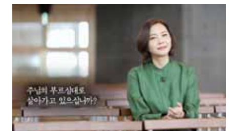
〈믿음의 고백 찬송이 되다〉

‘믿음의 유산’을 돌아보는 뜻깊은 프로그램들도 제작됐다. 3.1운동 100주년을 맞아 제작된 특집 다큐멘터리 〈낮은 곳에서 피는 봄〉은 국내외의 기독교 여성 독립운동가들의 믿음의 행적을 조명했다. 1919년 서대문 형무소 여옥사 8호실에 투옥됐던 기독교 여성 독립운동가들과 히와이에서 조국의 독립을 위해 헌신한 이들의 이야기를 의미 있게