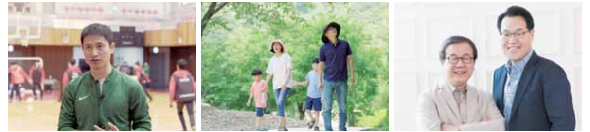
〈인플루언스, 위대한 영향력〉

2019년엔 CGNTV의 ‘새로운 도전’도 눈에 띄었다. 연초에 방영된 다큐멘터리 〈인플루언스, 위대한 영향력〉은 스포츠 선교라는 새로운 길을 제시해 화제를 모았다. LA 다저스 투수 클레이튼 커쇼, SK 와이번스